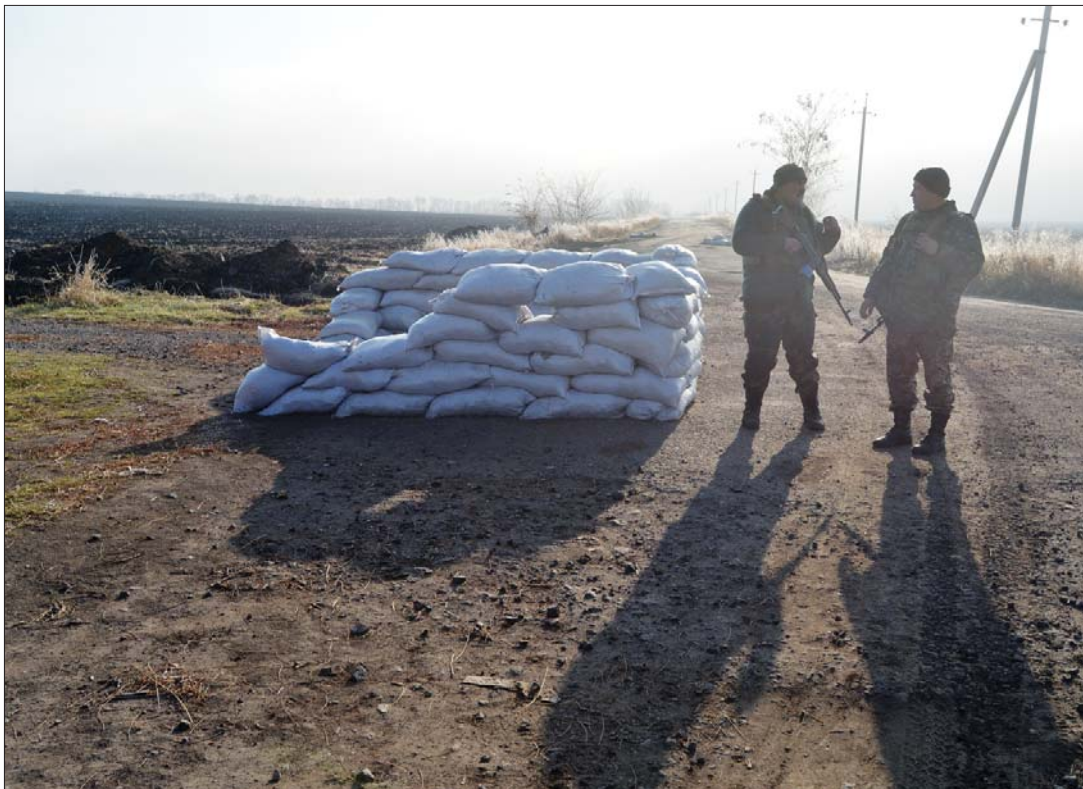
Щоб у полі чистим не пройшли сепаратисти.

Нынче Гитлер гордился б тобою: Вот как надо границы кроить! Захотелось тебе после Крыма В глотку новых кусков пожирней. В Украину ты без перерыва Посылаешь на бойню парней. Грезишь ты об имперском престиже. (Кровь течёт там уже не ручьём.) Ты ж глаза округляешь бесстыже, Мол, а я тут совсем ни при чём. Псков, Калуга, Владимир, Воронеж — Сколько мест ещё будет таких?.. Как бомжей, ты украдкой хоронишь «Добровольцев» погибших своих. Зёрна зла всюду с щедростью сея, Без паскудств ты не можешь ни дня. Будь ты проклята, Раша-Расея! И Господь да услышит меня! Слава Україні!