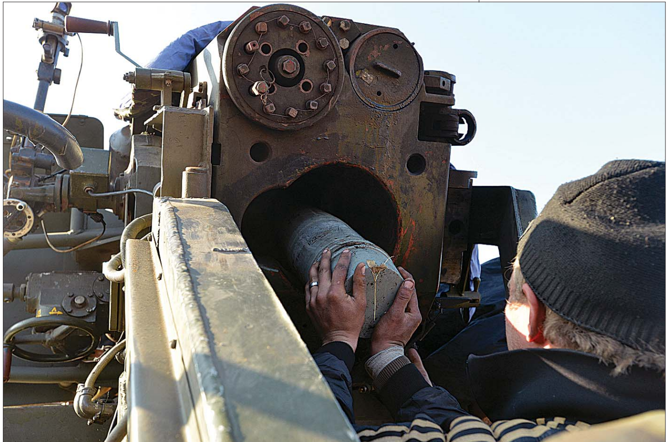
За якусь мить ворог відчужить міць бердичівських артилеристів.

У свою чергу міністр внутрішніх справ Арсен Аваков у Фейсбук повідомив: «Обговорюючи питання про батальйони, ми розглядали із Президентом моделі оптимального забезпечення розвитку добровольчих батальйонів МВС. Найбільш підготовлені бойові підрозділи повинні одержати як найвищий ступінь забезпечення озброєння, так і найкращу підготовку. Для цих цілей ухвалено рішення про передачу таких найбільш підготовлених підрозділів до складу Нацгвардії. Ми починаємо йти цим шляхом — шляхом підвищення боєздатності. Мною підписаний наказ про перехід до складу Нацгвардії Полку особливого призначення «Азов». Уже зараз розпочато роботу з доукомплектування полку до бойового стандарту бригад Нацгвардії».