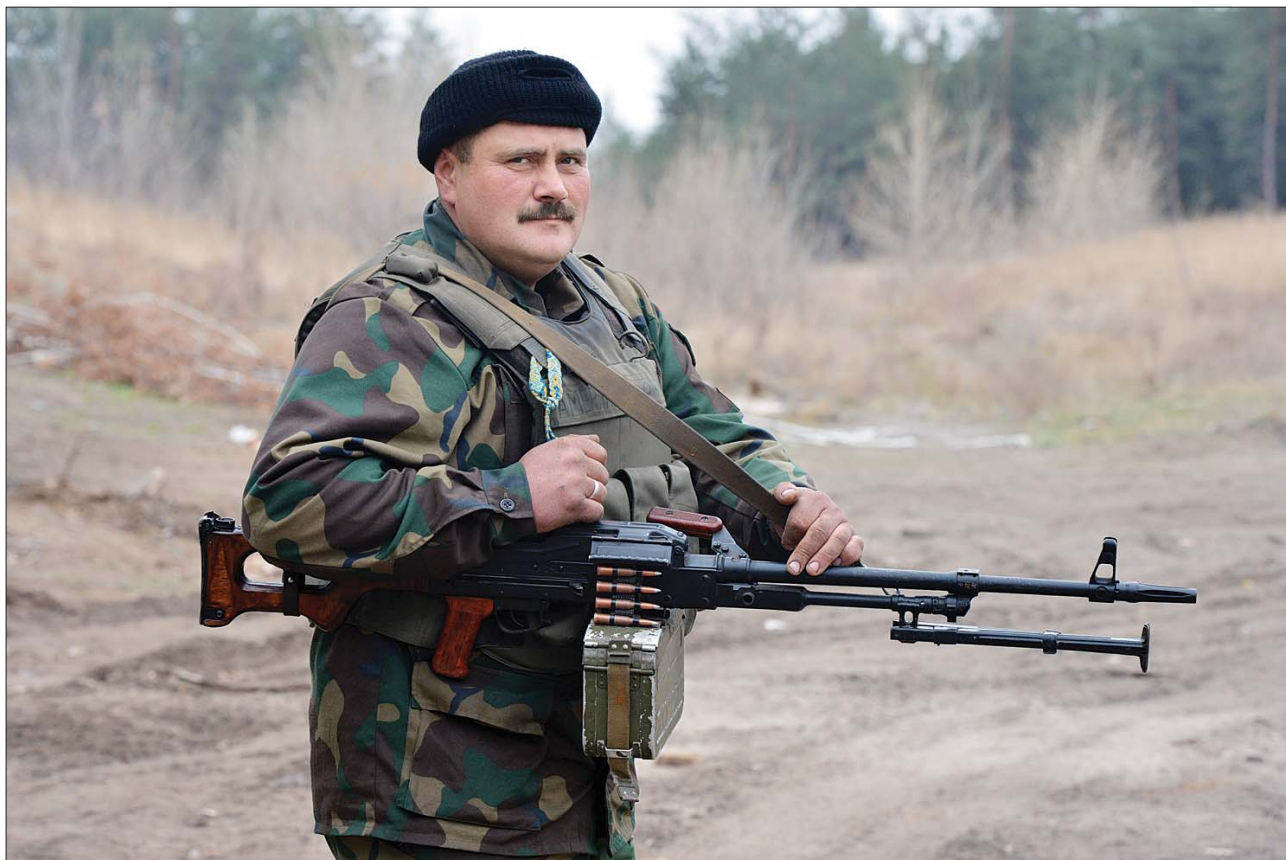
«Американ» у душі генерал. За глибоким вивченням місцевості — потенційний головний агроном Донбасу.

Це все зрозуміло. Але минуло вже досить часу, щоб по-азаровськи не списувати все на «папередників». Принаймні за місяці АТО можна було проаналізувати, що треба зробити для успішного проведення зимової кампанії. Те, що агресори не розпрощаються з нами на час холодів,