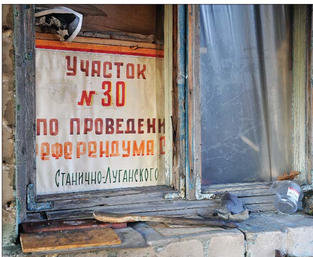
Таких референдумів тут більше не буде.

Проблеми у бердичівців сьогодні, напевно,