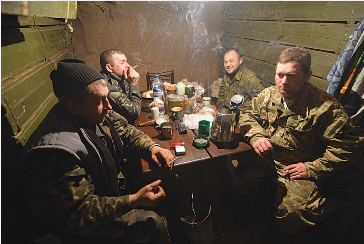
У «медичному» бліндажі, хвалити Бога, поки що затишшя.

Ще в бригаді — і не тільки в 26-й — обурюються відсутністю контрпропаганди в інформаційній війні. У визволеному Щасті, де ми також побували, наприклад, майже безперервно працює сепаратистське радіо. Новини, повірте, ще ті! Ми сміємося, але місцевим ця інформація навіє геть інші емоції. Коли десятки разів повторюють про злочини українських силовиків, які до того ж «за законом мають право на двох рабів-аборигенів», люди починають вірити навіть у гірші для себе перспективи, хоча на вулицях ніхто не затягає їх у ярмо, навпаки, діляться продуктами. А як діє на мізки російсько-радянська попса про «бать-