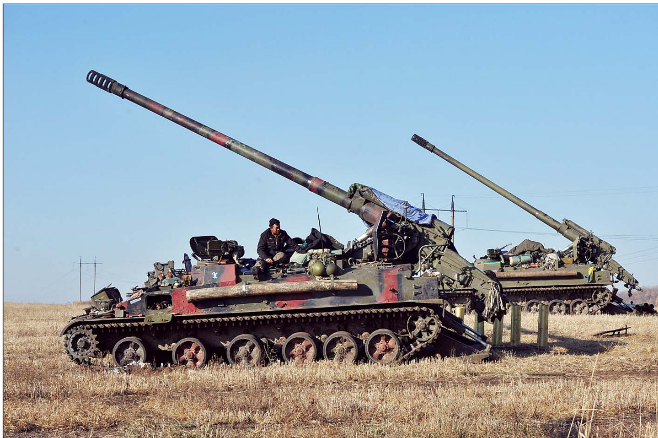
2С5 «Гіацинт-С» до виконання команди готові.